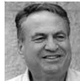
אלוף (מיל') עוזי דיין