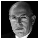
פרופ' עוזי ארד