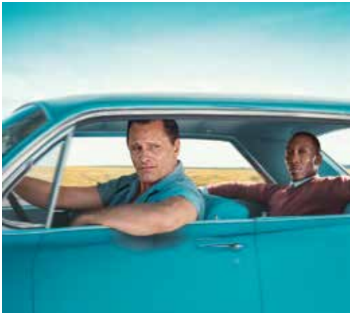
מתוך הסרט "הספר הירוק", ארה"ב 2018

במסגרת הקורס מוקרנים סרטי איכות טרם עלייתם לאקרנים, לפני שהם נחשפים לקהל הרחב. הסרטים נבחרים על-ידי צוות, בראשות מבקר הקולנוע יהודה סתיו , ומוקרנים בלוויית הרצאה של מומחה, המעשירה את חוויית הצפייה.