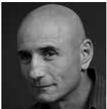
ח"כ עופר שלח