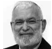
אלוף (מיל') יעקב עמידרו