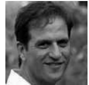
ד"ר יוסי חלמיש, רופא וחוקר מוח

ימי שני 11:30-13:00, מוזאון ארצות המקרא, רח' גרנות 25, ירושלים