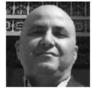
ד"ר עוזר ציון, היסטוריון וחוקר של דתות ותולדות הרעיונות

ימי שלישי 9:30-11:00, קמפוס האוניברסיטה הפתוחה בגן הטכנולוגי, מלחה, ירושלים