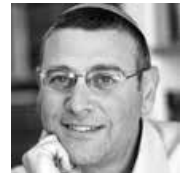
הרב ד"ר בני לאו

ימי שלישי 9:30-11:00, מוזיאון ישראל, שדרות רופין 11, ירושלים