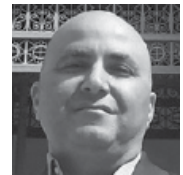
ד"ר עודד ציון, היסטוריון, חוקר דתות ותולדות הרעיונות

ימי שני 18:00-19:30, קמפוס האוניברסיטה הפתוחה, דרך האוניברסיטה 1, רעננה