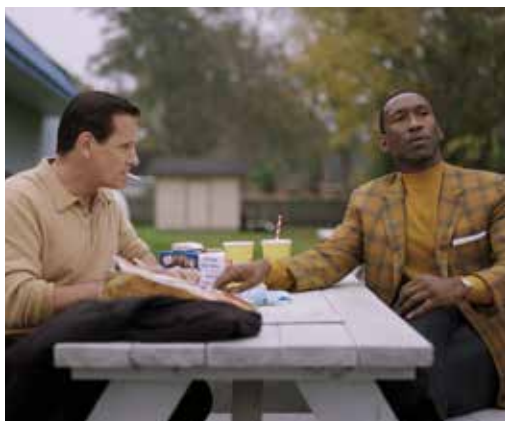
מתוך הסרט "הספר הירוק", ארה"ב 2018

*מידע על הסרט והמרצה ישלח לפני כל מפגש לדוא"ל הפרטי שלכם.